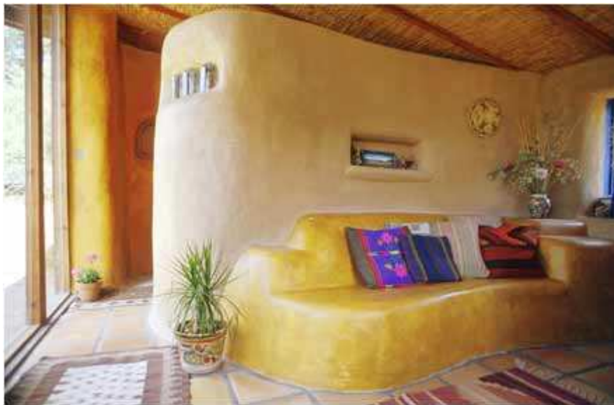
Photo du bâtiment en technologie d'argile